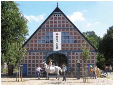
Wendlandhof Lübeln Ausstellung rund um Handwerk und Restauration (Eintritt frei)