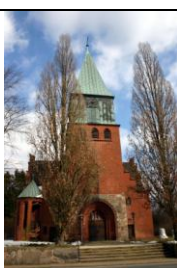
Kirche Schnega Ziegelbau mit Feldsteinfundamenten, 1913; Apsis des 14.Jh.