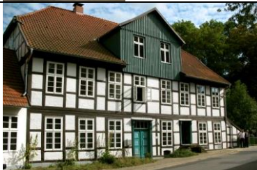
Schnega Mühle, Langestr. 7 (Zweigeschossiges Fachwerkgebäude 1870)