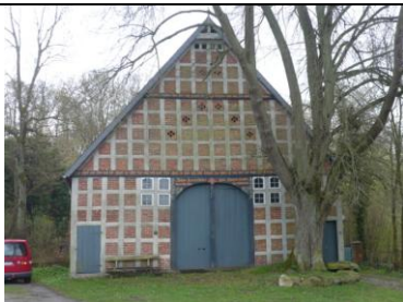
Bussau 8, (Vierständer 1852)