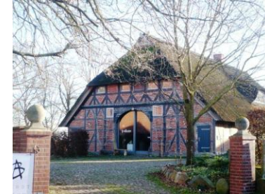
Dambeck 6 (Zweiständer 1734)