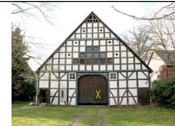
Köhlen 13 (Vierständer 1794)