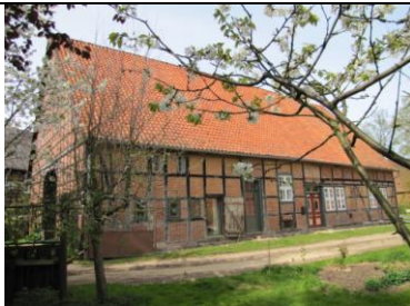
Beesem 3 (Vierständer 1865) Der Zimmerer erklärt seine Arbeiten am Haus