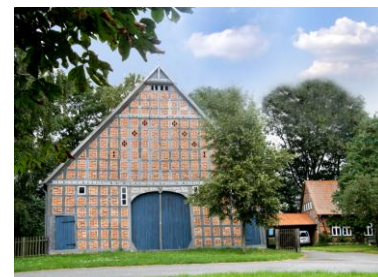
Loge 1 (Vierständer 1826)