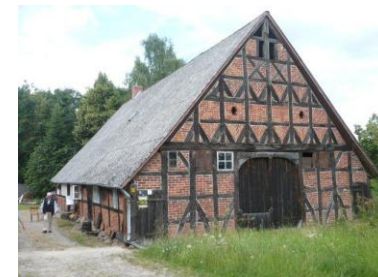
Weitsche 6 (Zweiständer 1716)