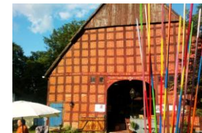
Jabel 20 (Vierständer 1838)