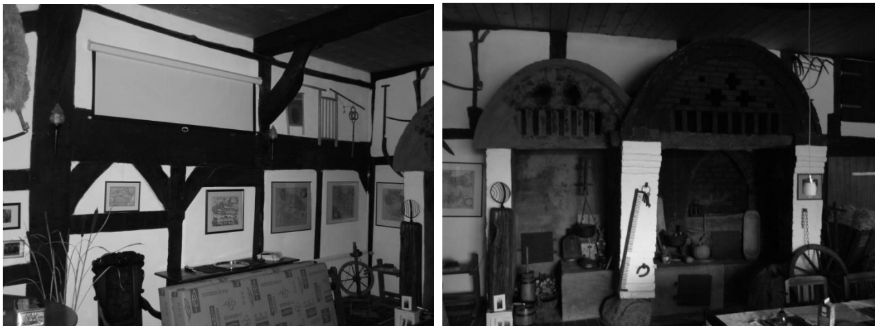
Abbildung 2: a. Luchtriegel W-Seite mit Zwischenstiel, Kopfbändern und Riegel; b. Doppelschwibbogen auf der Diele.