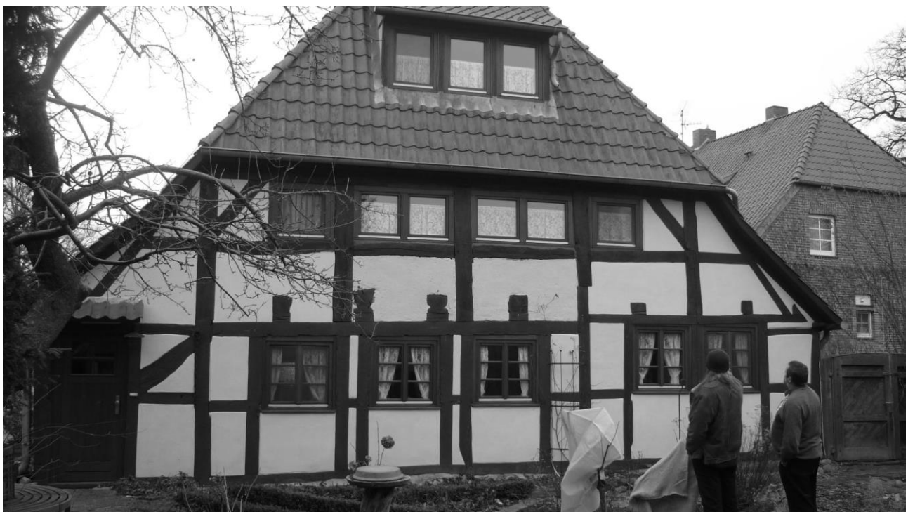
Abbildung 3: Wohngiebel. Die Ostseite des Hauses ist im Bild links (Foto: Wübbenhorst, Februar 2011).