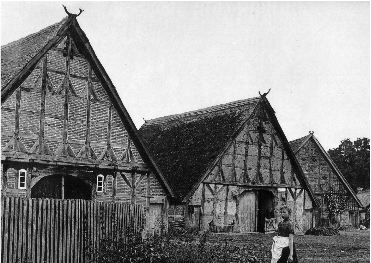
Abbildung 4: Die historische Aufnahme zeigt das Haus zwischen weiteren Gebäuden gleichen Alters, die inzwischen abgerissen wurden. (Foto: Dreesen, 1903).